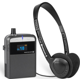
Taschenempfänger SYNEXIS RP8 mit Kopfhörer