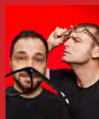
JAHNHALLE 25.01. Eure Mütter

Mit freundlicher Unterstützung des Fördervereins der Realschule Bad Rotenfels. Gibt es nur im Kulturamt - mit Schülerausweis!