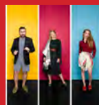
03.02. Chilli da Mur