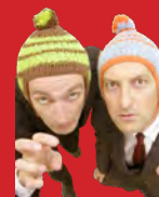
01.03. Ulan & Bator