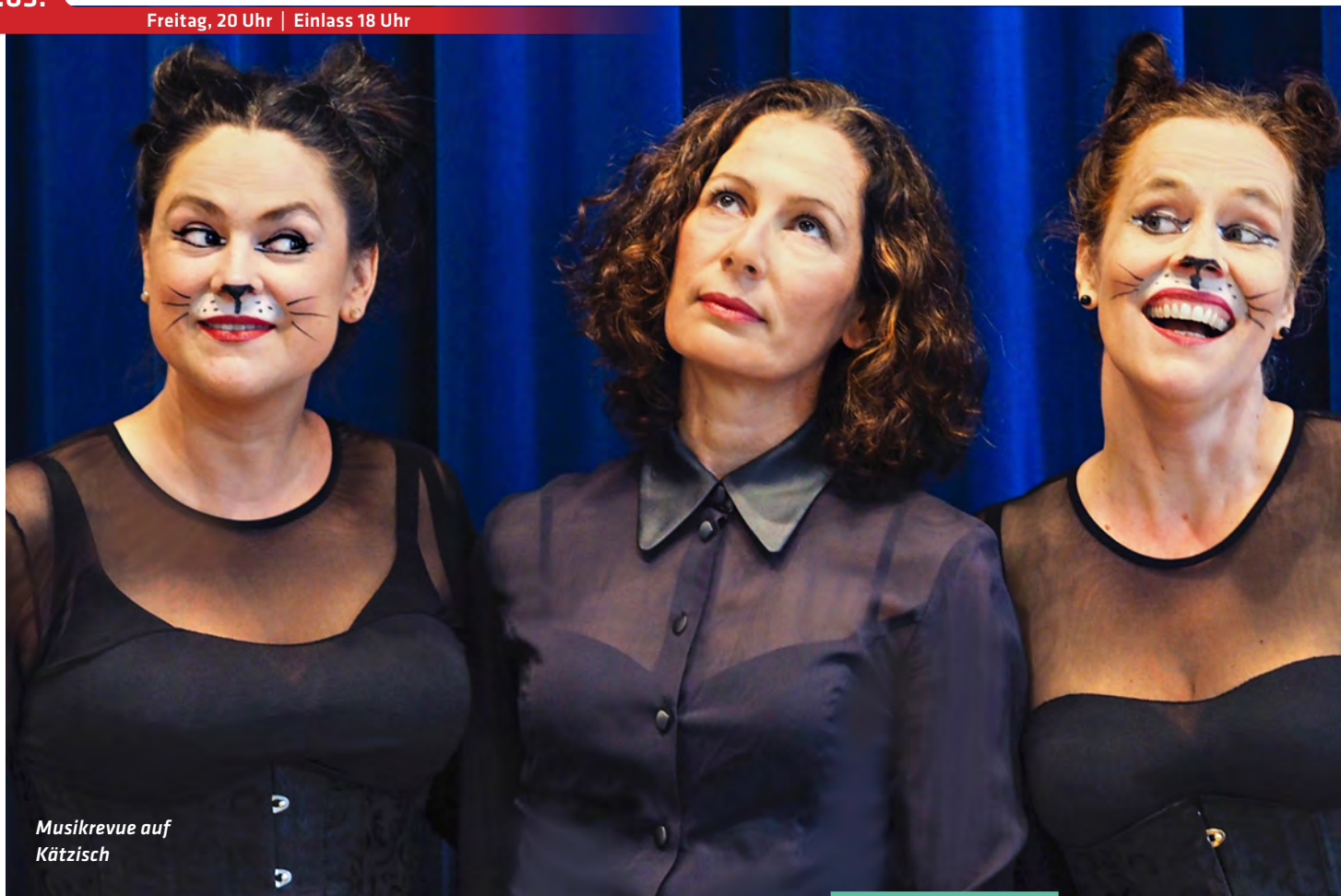
Musikrevue auf Kätzisch