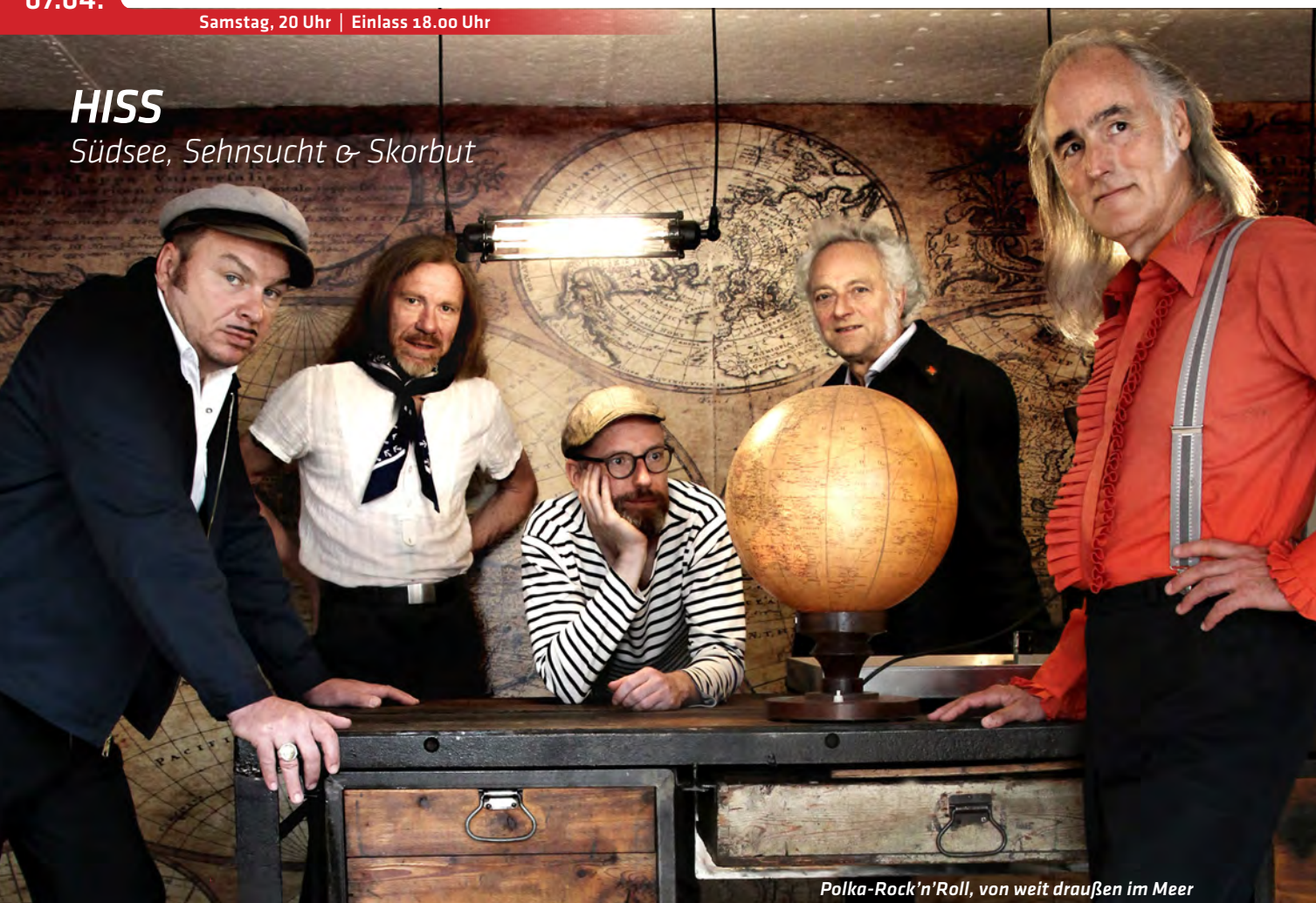
Polka-Rock'n'Roll, von weit draußen im Meer

Es ist wahrlich erstaunlich, dass HISS auf den unzähligen Konzerten der letzten Jahrzehnte kaum von ihren Abenteuern auf hoher See berichteten. Dabei trotzten sie Tsunamis und Taifunen, der sengenden Sonne des Südens und dem erbarmungslosen Eismeer. Die fünf wilden Kerle überstanden gefährliche Begegnungen mit Haien, Schmugglern und Korsaren. Sie zechten und sangen in Cartagena und Wladiwostok, in Kapstadt und Shanghai. Auf ihrem brandneuen achten Album erzählen uns HISS endlich von ihren unglaublichen Erlebnissen auf den Meeren und in den Häfen, von der harten Arbeit an Deck und im Maschinen-