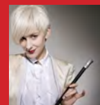
27.04. Lisa Eckhart