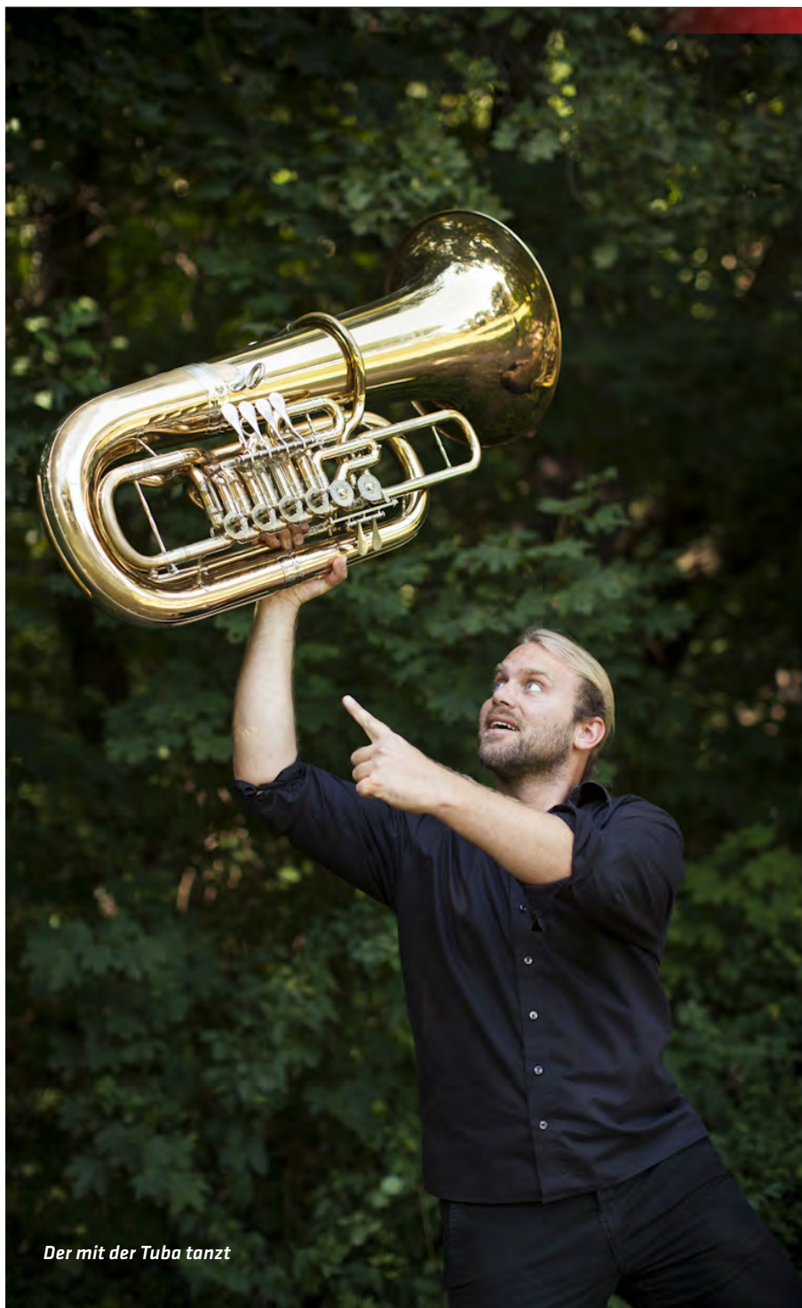
Der mit der Tuba tanzt