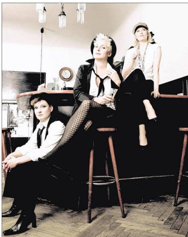
MIT „THE CAT PACK“ folgt Teil zwei der Show „Sekt and the City“, die beim vergangenen Programm 300 Damen vor die Bühne zog.

Schrill wird es am nächsten Donnerstag, 15. Januar, um 20.30 Uhr. Kay Ray, das Enfant terrible der deutschen Comedyszene macht im Rantastic Station. Der selbst ernannte Edelpunk polarisiert. Man liebt ihn oder man hasst ihn.