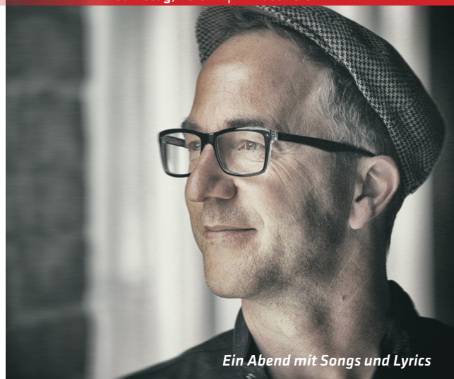
Ein Abend mit Songs und Lyrics