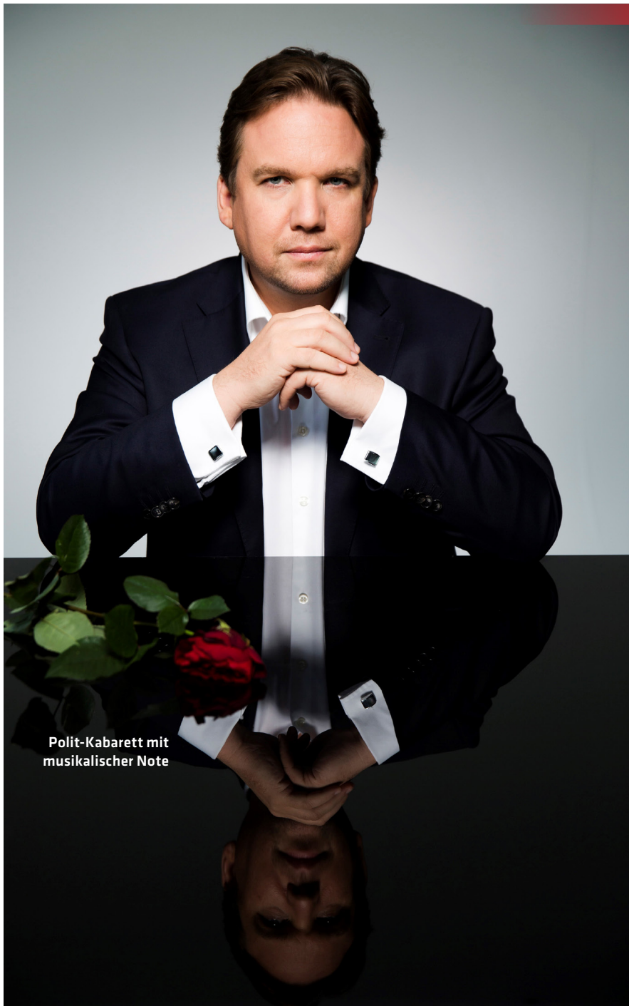
Polit-Kabarett mit musikalischer Note