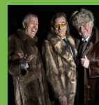
FR 25.01. KGB